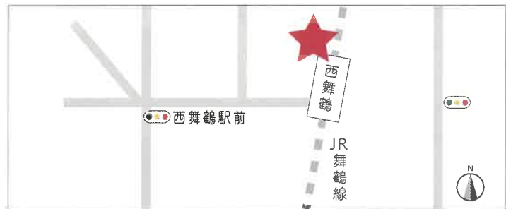
JR 舞鶴線「西舞鶴駅」構内

〒624-0816 舞鶴市字伊佐津 213-8 TEL:0773-78-9300