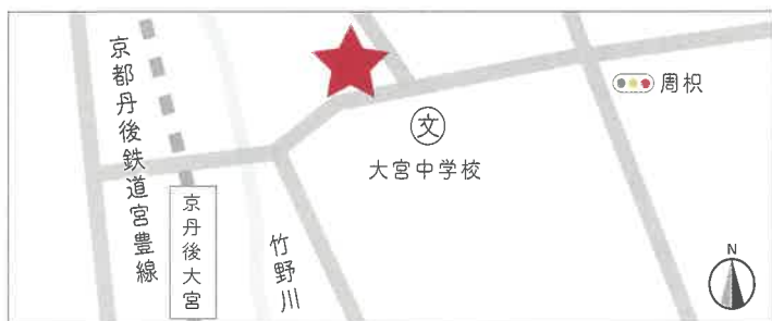
京都丹後鉄道宮豊線「京丹後大宮駅」から徒歩10分

〒629-2501 京丹後市大宮町口大野 228-1 TEL:0772-69-0662