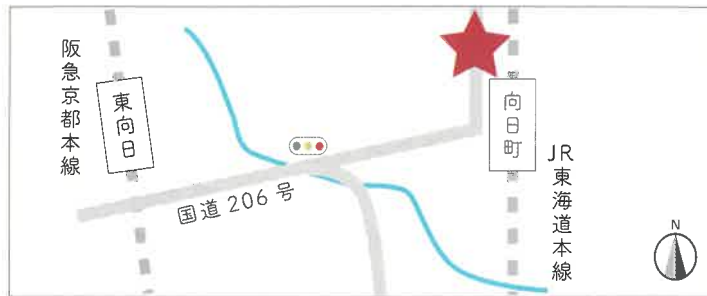
JR 東海道本線「向日町駅」から徒歩3分 阪急京都本線「東向日駅」から徒歩10分

〒617-0002 向日市寺戸町瓜生 22-1 TEL:075-874-2031